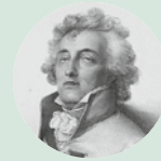
Charles de Ligne