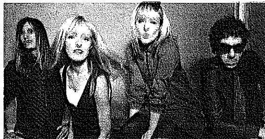
Los miembros del grupo Dover, en una imagen promocional.

El grupo ha decidido celebrar su puesta de largo recordando en directo cada uno de los temas que componían "Devil came to me", así como otros muy conocidos y compuestos posteriormente, en una gira que iniciaron en Valen-