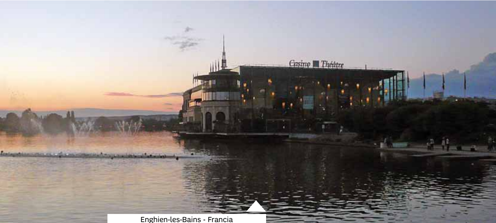
Enghien-les-Bains - Francia