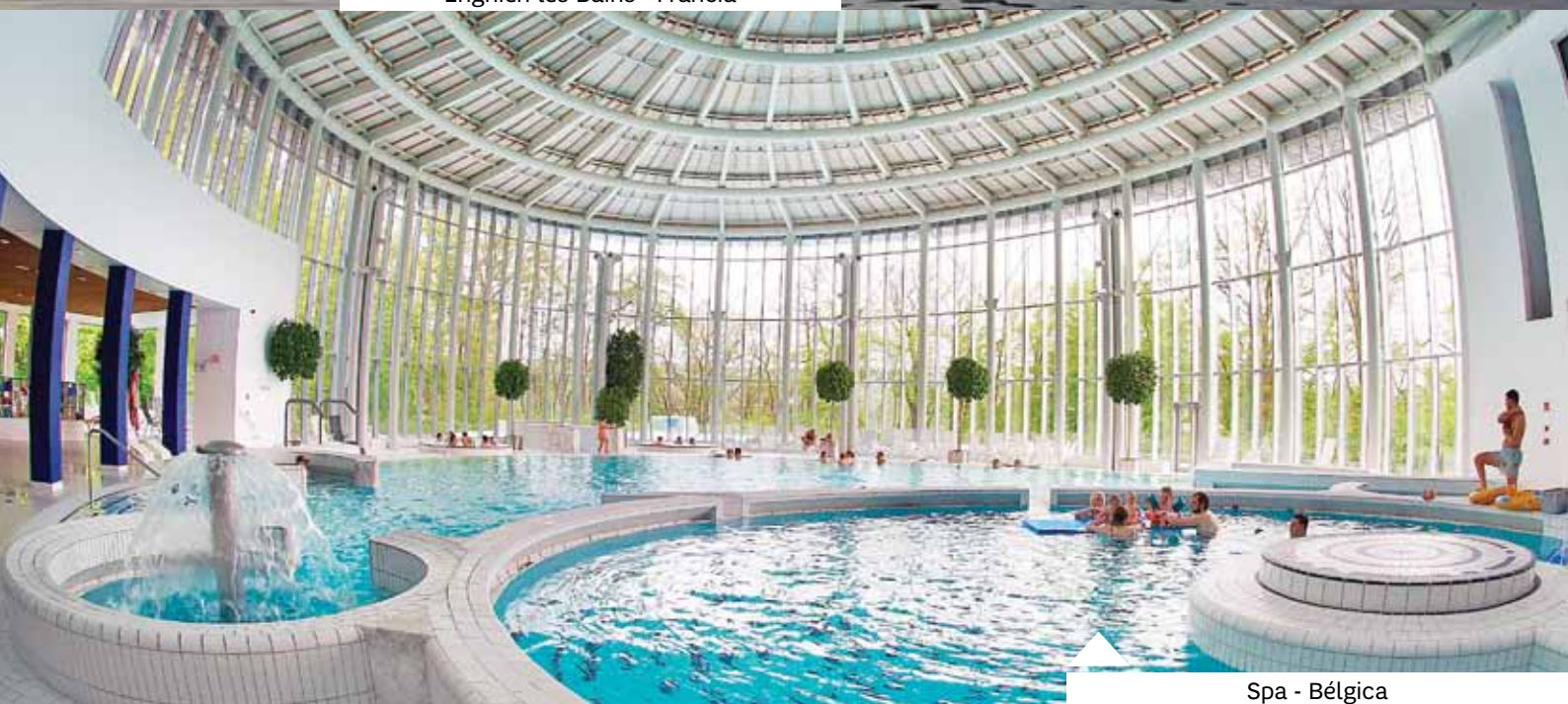
Spa - Bélgica