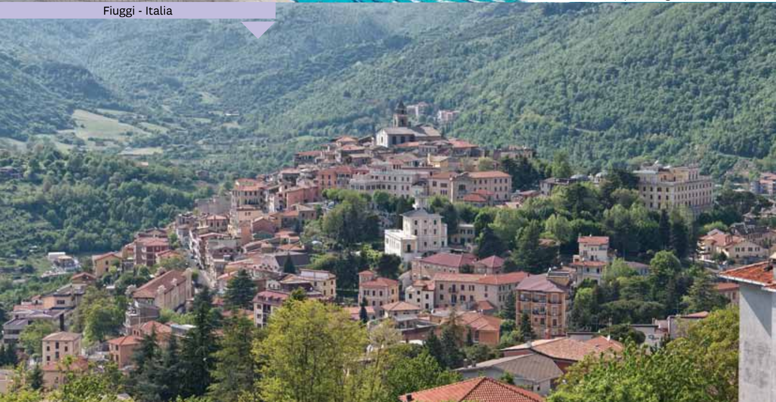
Fiuggi - Italia