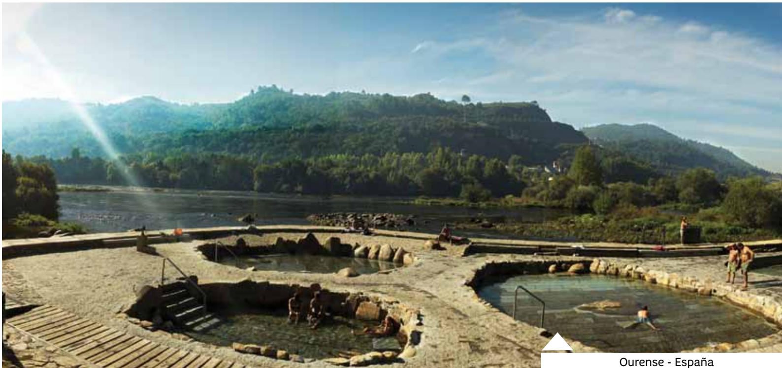
Ourense - España