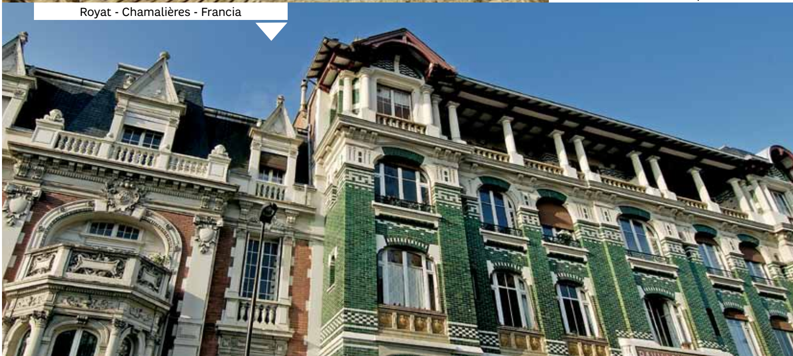
Royat - Chamalières - Francia