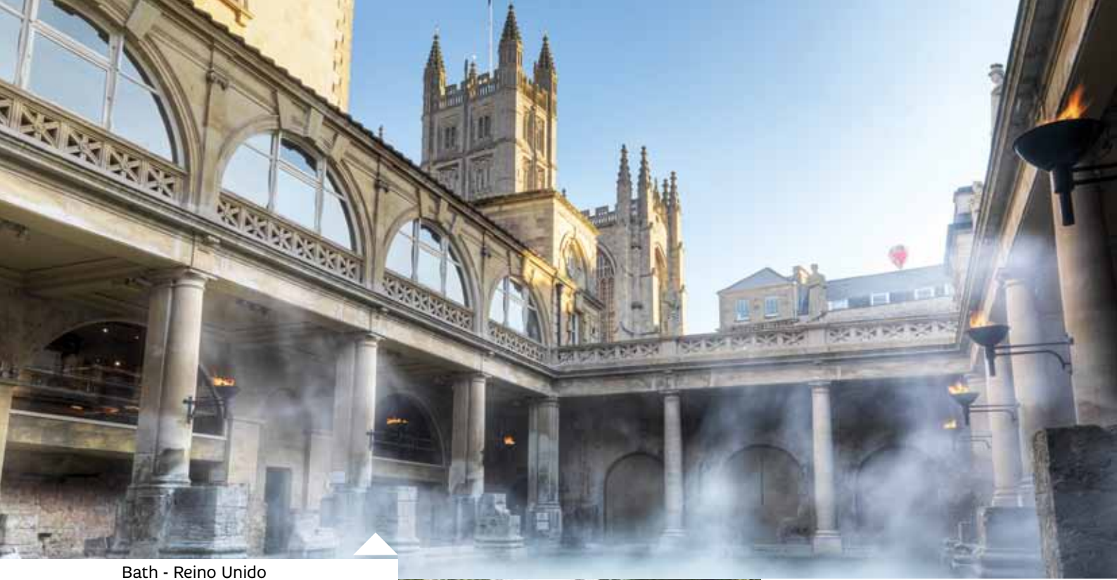
Bath - Reino Unido