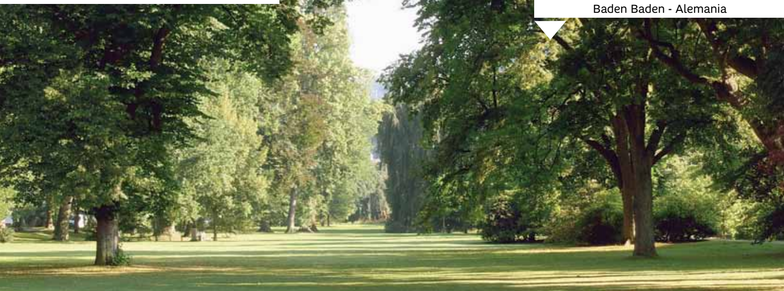
Baden Baden - Alemania